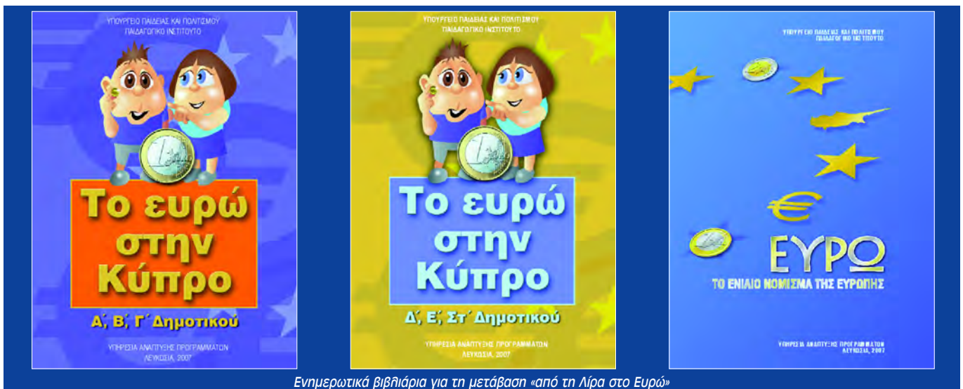
Ενημερωτικά βιβλιάρια για τη μετάβαση «από τη λίρα στο Ευρώ»