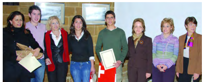
Η ομάδα του Λυκείου Αγίου Αντωνίου Λεμεσού που πήρε το Α' βραβείο

Η φετινή εκδήλωση έγινε στα πλαίσια των εορτασμών του Διεθνούς μήνα της Γαλλοφωνίας και της ένταξης της Κύπρου ως συνεδεδεμένο μέλος στο Διεθνή Οργανισμό της Γαλλοφωνίας το Σεπτέμβριο του 2006.