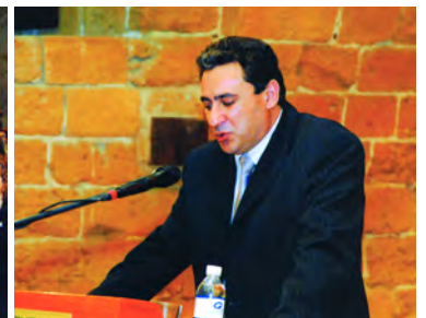
Ημερίδα για τον Οδυσσέα Ελύτη